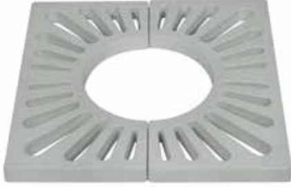
Composite Tree Grate Set 60X60X4 Kompozit Ağaç Dibi Izgara Takımı 60X60X4

Dimensions/Ölçüler : 600mm.x600mm. Interior Span /Izgara İçi: Ø300mm.