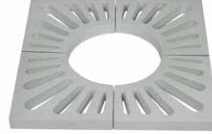
Composite Tree Grate Set 60X60X4 Kompozit Ağaç Dibi Izgara Takımı 60X60X4

Dimensions/Ölçüler : 600mm.x600mm. Interior Span /Izgara İçi: Ø300mm.