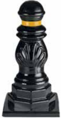
Composite Bollard With Led-47cm.