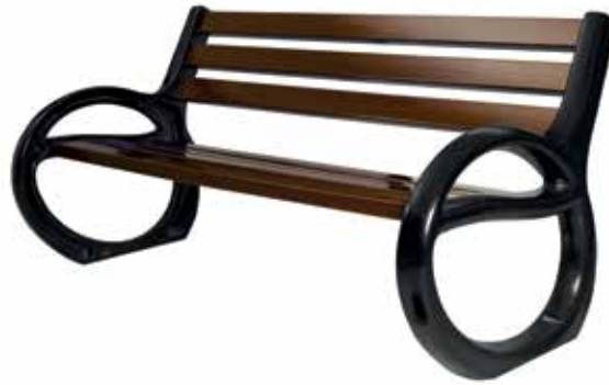
Composite Bench With Armrest