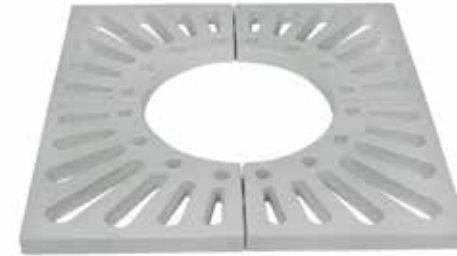
Composite Tree Grate Set 100x100x5 Kompozit Ağaç Dibi Izgara Takımı 100x100x5

Dimensions/Ölçüler: 1000mm.x1000mm. Interior Span /Izgara İçi: Ø500mm.